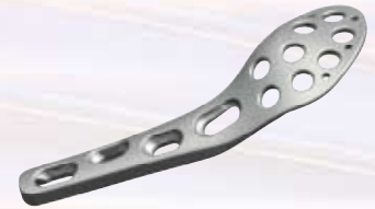
股骨远端内侧接骨板 Distal Medial Femoral Plates