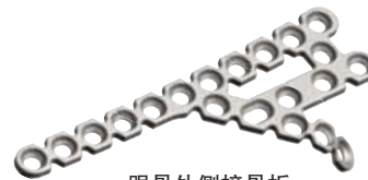
跟骨外侧接骨板 Lateral Calcaneal Plates