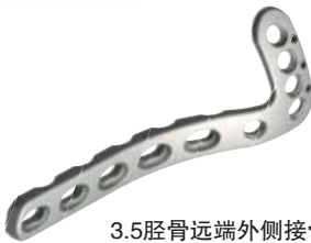
3.5胫骨远端外侧接骨板 3.5mm Distal Lateral Tibial Plates