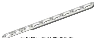
腓骨远端后/外侧接骨板 Distal Posterior/Lateral Fibular Plates