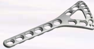
桡骨远端背侧A型接骨板 Distal Dorsal Delta Radial Plates