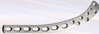
肱骨远端后/外侧接骨板 Distal Posterior/Lateral Humeral Plates