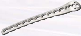
尺骨近端背侧接骨板 Proximal Dorsal Ulnar Plates