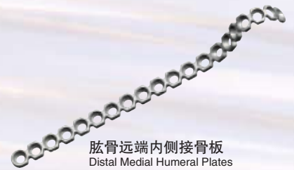
肱骨远端内侧接骨板 Distal Medial Humeral Plates