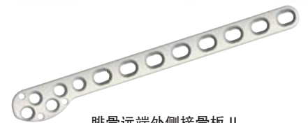
腓骨远端外侧接骨板 II Distal Lateral Fibular Plates-II