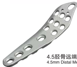
4.5胫骨远端内侧接骨板 4.5mm Distal Medial Tibial Plates