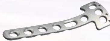
4.5胫骨近端内侧接骨板 4.5mm Proximal Medial Tibial Plates