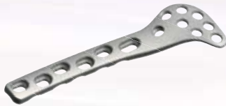
股骨远端外侧接骨板 II Distal Lateral Femoral Plates-II