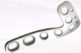
胫骨近端外侧接骨板 II Proximal Lateral Tibial Plates-II